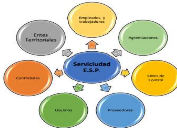
IMAGEN Nª1. PARTES INTERESADAS